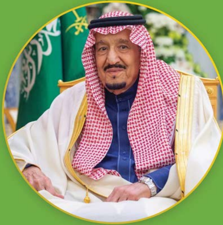
خادم الحرمين الشريفين الملك سلمان بن عبد العزيز