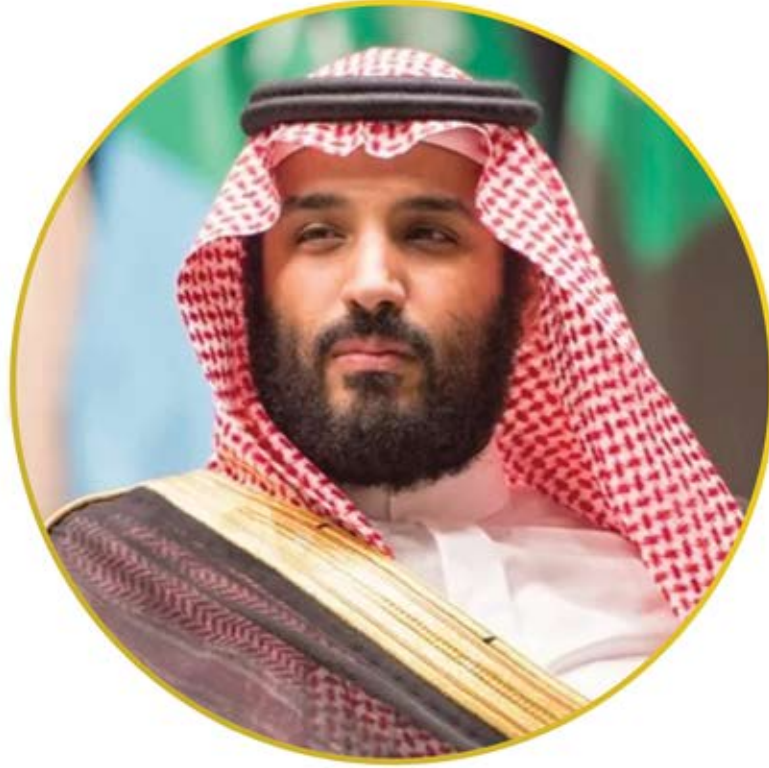
صاحب السمو الملكي الأمير محمد بن سلمان بن عبد العزيز آل سعود ولي العهد نائب رئيس مجلس الوزراء ووزير الدفاع