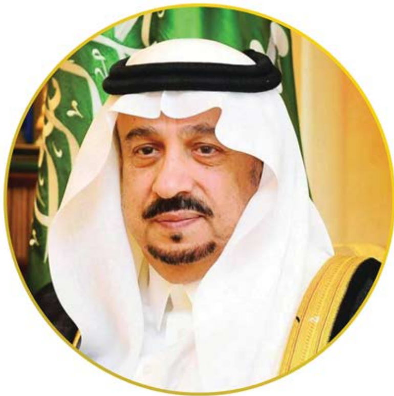
صاحب السمو الملكي الأمير فيصل بن بندر بن عبدالعزيز آل سعود أمير منطقة الرياض رئيس مجلس إدارة جمعية البر الأهلية بالرياض